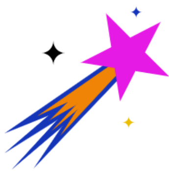
Förderung von Talenten