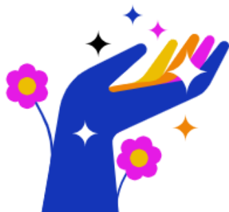
Teamspirit & Vielfalt