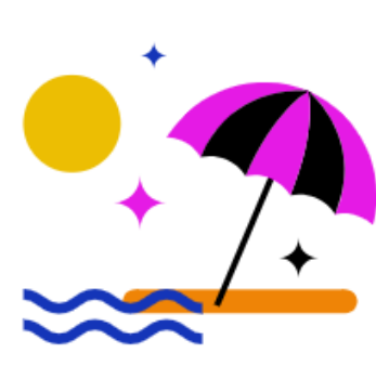
30 + 2 Tage Urlaub